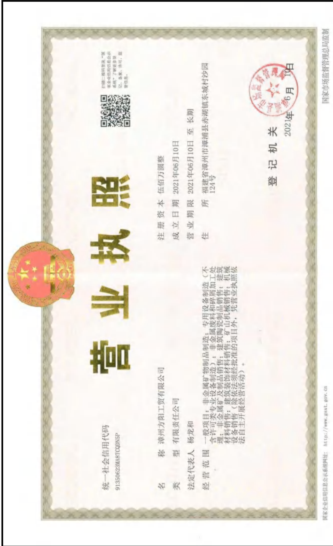
附件 2 项目营业执照